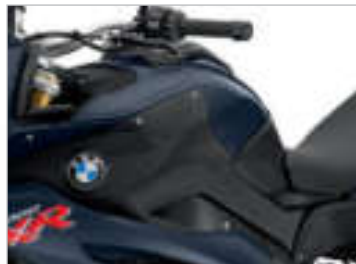
Ozeanblau metallic matt NOM / Sitzbank schwarz *3