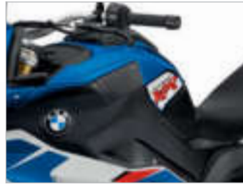
S 1000 XR HP mit HP Motorsport-Lackierung: Lightwhite uni/Racingblue metallic/ Racingred uni N2E / Sitzbank schwarz *2